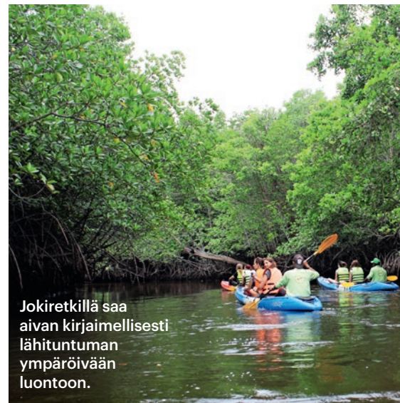
Jokiretkillä saa aivan kirjaimellisesti lähituntuman ympäröivään luontoon.