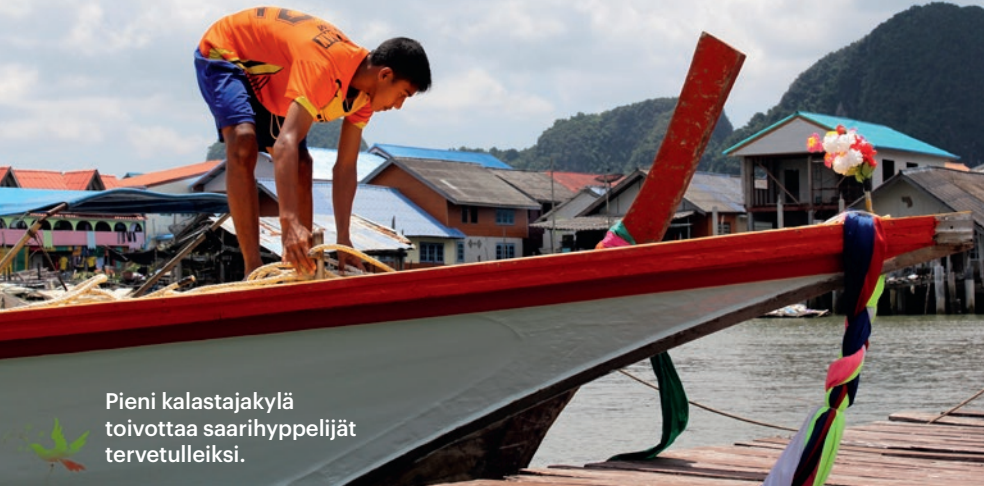
Pieni kalastajakylä toivottaa saarihyppelijät tervetulleiksi.